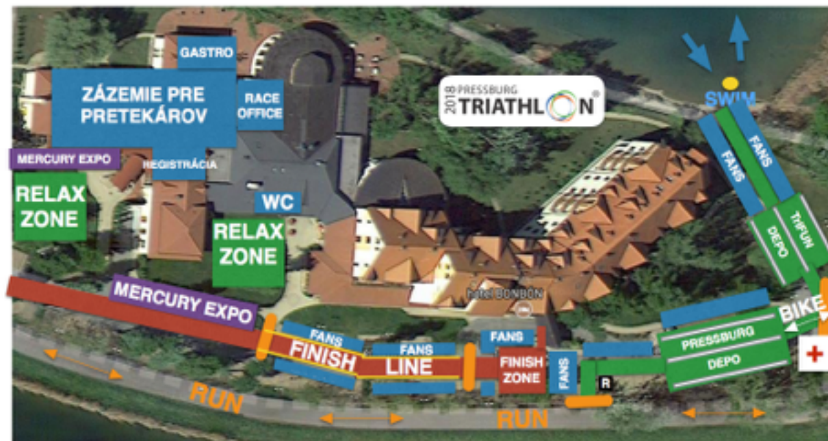
SITUAČNÁ MAPA - podrobný RACE MANUAL bude zverejnený na etriatlon.sk

Oficiálne výsledky súťaže budú dostupné na stránke www.etriatlon.sk